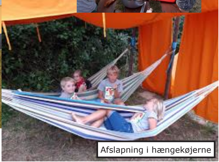
Afslapning i hængekøjerne