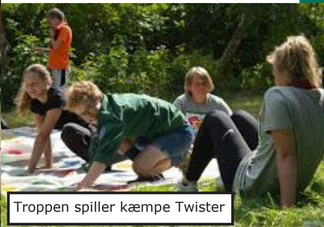
Tropen spiller kæmpe Twister