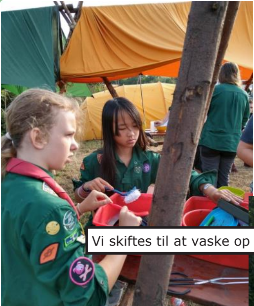
Vi skiftes til at vaske op og lave mad