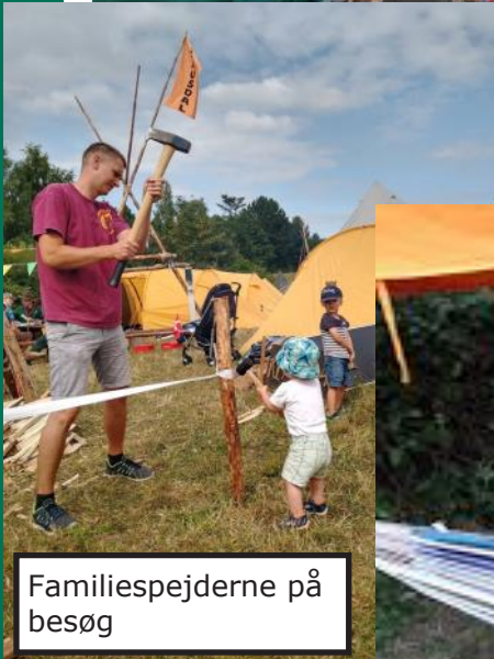
Familiespejderne på besøg